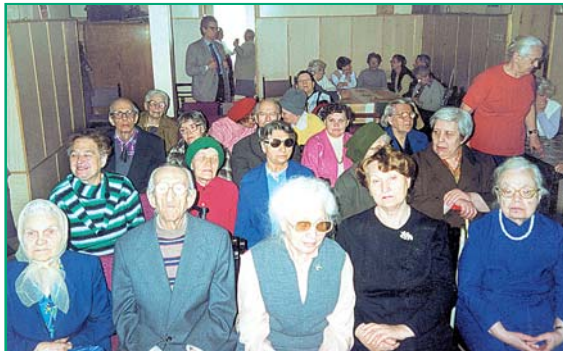
Музыка, врачующая душу. На концерте учащихся музыкальной школы имени Гнесиных

Если до 01.04.02 необходимые документы (справка о зарплате и др.) не могут быть представлены, то до этой даты следует подать заявление о перерасчете пенсии с учетом дополнительных документов, а в течение последующих 3-х месяцев - до 1 июля 2002 года - донести сами документы. В этом случае пенсии будут пересчитаны с 1 января 2002 года. Гражданам, представившим документы после 01.07.02 перерасчет пенсии будет производиться с 1-го числа месяца, следующего за месяцем, в котором было подано заявление с приложением всех необходимых документов.