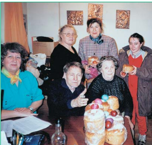
Раздача пасхальных куличей, выделенных районной Управой Совету инвалидов